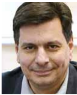
Άρθρο του Πέτρου Ψωμά*

Μπορεί η Πάτρα να μετασχηματιστεί σε σύγχρονη ευρωπαϊκή πόλη; Μπορεί και πρέπει. Λόγω μεγέθους, λόγω κύρους, λόγω ιστορίας. Και εξ' ανάγκης. Πότε θα συμβεί; Αργεί, δυστυχώς. Πολύ. Και είναι ευθύνη της δημοτικής αρχής αυτή η καθυστέρηση. Πάλι η δημοτική αρχή φταίει; Μήπως υπερβάλλετε; Καθόλου. Είναι αποκλειστική ευθύνη του δήμου η μετεξέλιξη μιας πόλης. Και μια δη-