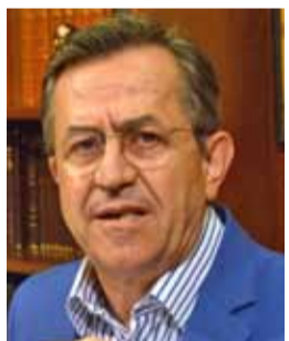
Του Νίκου Νικολόπουλου*

Ο Κρατικός προϋπολογισμός αποτελεί τον επίσημο απολογισμό της κυβερνητικής πολιτικής και ταυτόχρονα τον οδηγό για το μέλλον. Ωστόσο, ο προϋπολογισμός του 2015, τον οποίο αρνήθηκε να υπερψηφίσει ακόμα και ο τότε πρόεδρος της Νέας Δημοκρατίας, Αντώνης Σαμαράς, άφησε ανεξίτηλο το στίγμα του στις πολιτικές εξελίξεις. Η στάση αυτή όχι μόνο ανέδειξε τις αντιφάσεις εντός του κόμματος που σπύριζε την κυβέρνηση, αλ-