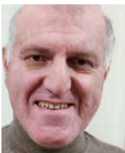
Του Γ. Η. Ορφανού

Κ αθημερινά, δίνονται πολλές αφορμές και ευκαιρίες να συγκρίνουμε τα περασμένα χρόνια με το σήμερα. Άλλοτε, για να βράζουμε στα σπινθηράκια, χρησιμοποιούσαμε μπρίκι ή τσουκάλι. Τώρα έχουμε τους υπερσύγχρονους βραστήρες. Στα παιδικά μας χρόνια, για να έχουμε ως γρήγορο φαγητό τη-