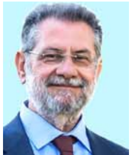
Του Ανδρέα Παναγιωτόπουλου*

Πεντέμισι χρόνια διακυβέρνησης της ΝΔ η ανάπτυξη παραμένει ουσιαστικά καθλωμένη, η ακρίβεια πλήττει βάνουσα τα ελληνικά νοικοκυριά, ενώ οι κοινωνικές και οικονομικές ανισότητες συντηρούνται και διευρύνονται.